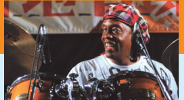
「マーティーブレイシー」プロフィール